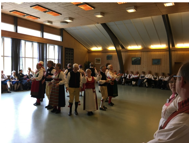
Leksands Folkdanslag ved venskabsbytræffet i Lillehammer

OG SE HVAD FOLKEDANS ER OG FÅ EN GARANTERET RIGTIG GOD OG FORNØJELIG AFTEN TIL LEVENDE MUSIK.