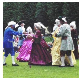
Caroline Mathilde 250år Dans: Menuet