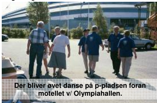
Der bliver øvet danse på p-pladsen foran motellet v/ Olympiahallen.

2003 , Nytårsfest d. 18. januar i Menighedshuset med 45 deltagere. 8. marts, Opvisning og Legestue i Kantine. 100 deltagere. Flere 25års medlemsjubilare blev fejret denne aften. Ved Hørsholm Kommunes idrætsmodtagelse 2003 d. 29.april, havde foreningen indstillet "Sjælsø Kvadrillen". Denne bestod bl.a. af 7 medlemmer fra Hørsholm Folkedansforening. Kvadrillen havde ved DM i folkedans 2002 vundet Bronze. Prismodtagelsen foregik i "Trommen" hvor de sammen med mange andre idrætsudøvere fra kommunen modtog en lille hædersgave. 4. – 9. juni. 31 medlemmer i bus samt 5 personer i bil kører af sted mod Lillehammer. Målet var Venskabsbytræffet. Vi var kørt en dag tidligere da weekenden faldt sammen med Grundlovsdagen. Vi overnattede i Hamar på Hamar