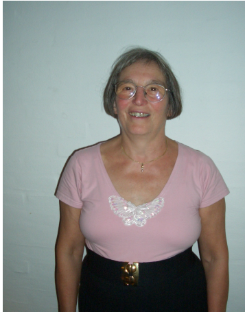
Vores nye formand m/k