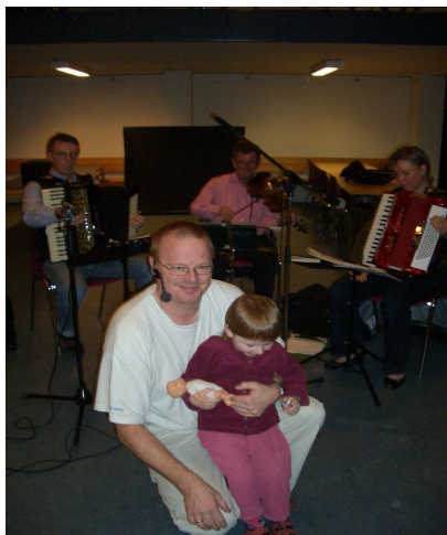
Vores nye danseleder med assistent