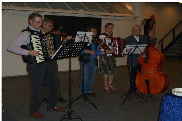
Musik til sydøsteuropæiske danse