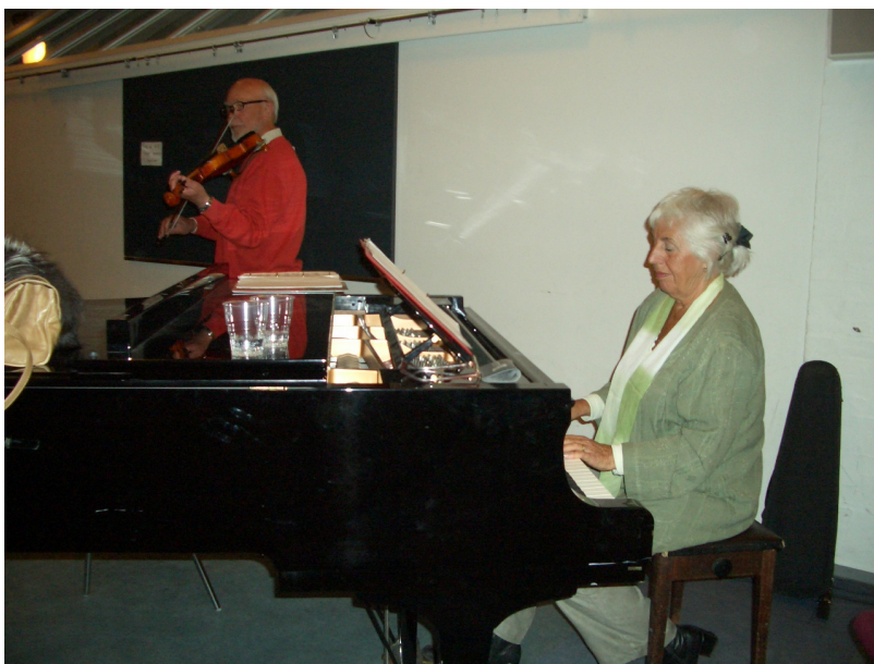
Hel suveræn underlægningsmusik til viseaften